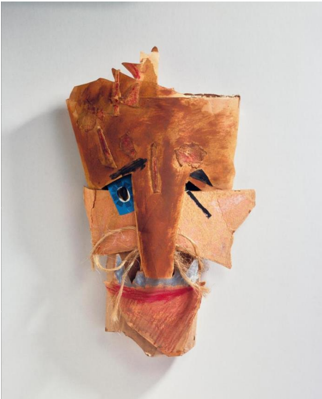
Marcel Janco, Masque , 1919, Papiers collés, carton, ficelle, retouches gouache et pastel, 45 x 22 x 5 cm, Centre Pompidou, Paris