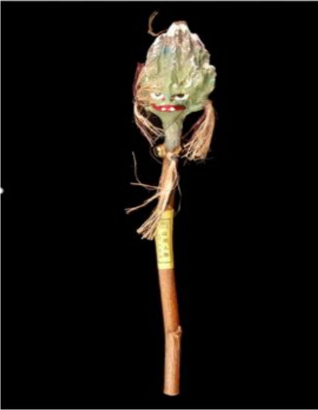
Tête de génie de la montagne Yamabiko Terre cuite peinte, fibres, métal (grelot), bois (manche) Milieu du XX e siècle 29,5 x 5 x 4,5 cm Musée du quai Branly - Jacques Chirac, Paris

Document n° 1 : Ressources iconographiques qui seront mobilisées, pour tout ou partie, dans la composition et/ou le déroulé de la séance.