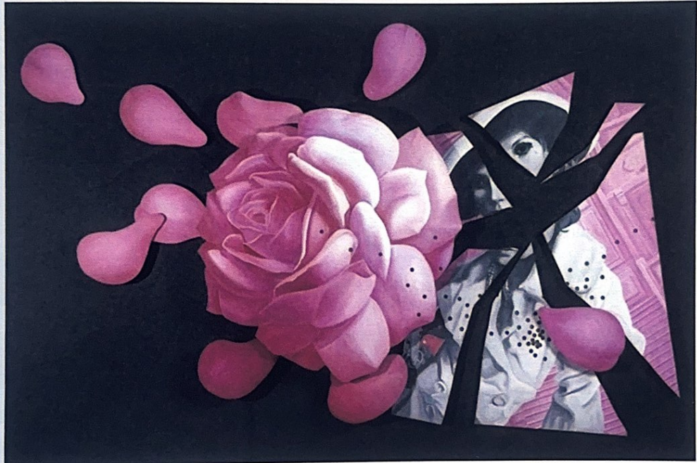
Jacques MONORY La fin de Madame Gardénia 1964/66 Huile marouflée sur toile 280 x 320 cm Pau, Musée des Beaux-Arts