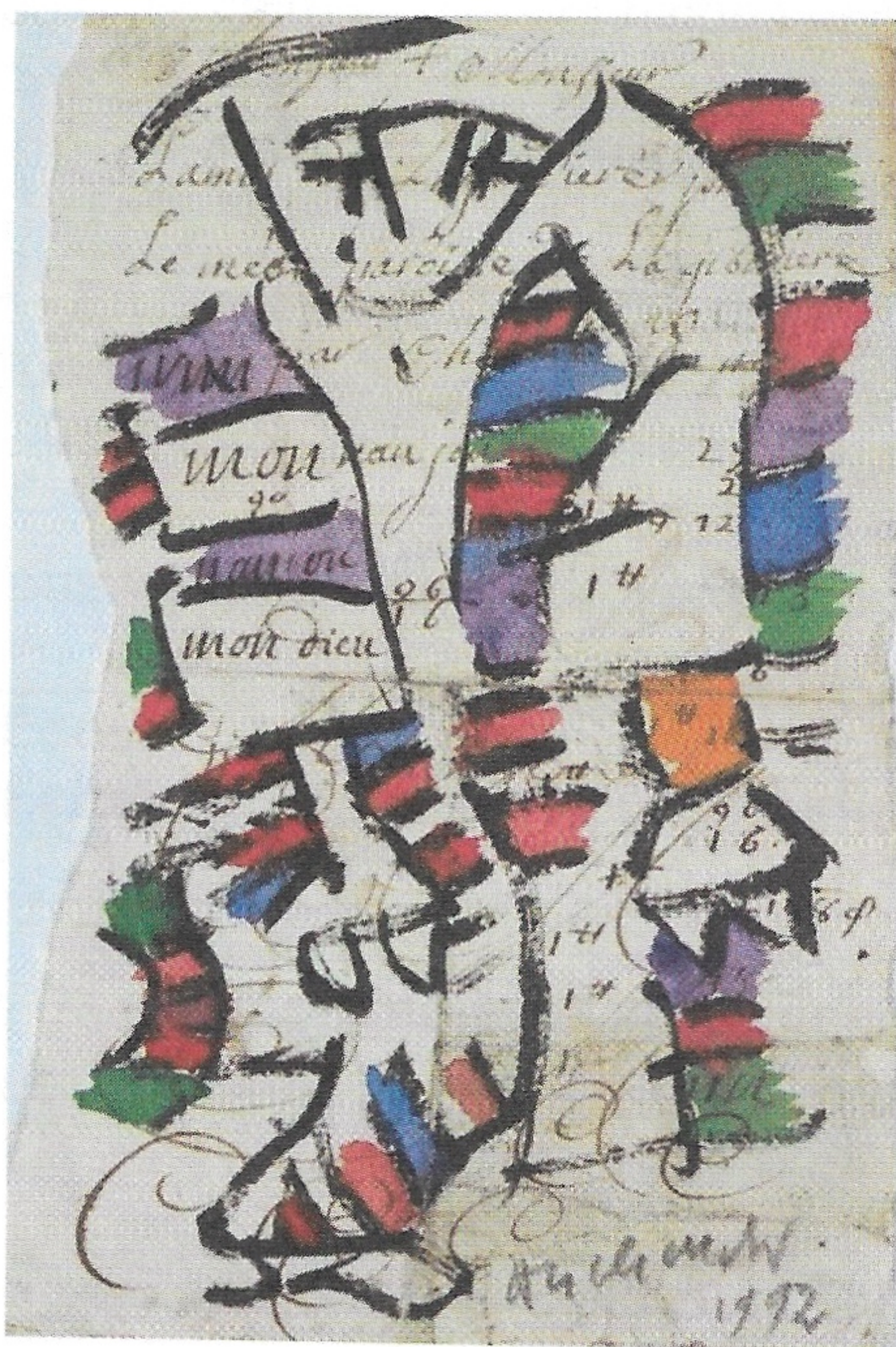
Pierre Alechinsky (1927 -), Sorti de la poche , 1992, encre de Chine et aquarelle sur vergé du XVII e siècle (pièce avec écritures et essais de plume), 19,5 x 13 cm, Paris, centre Georges Pompidou.