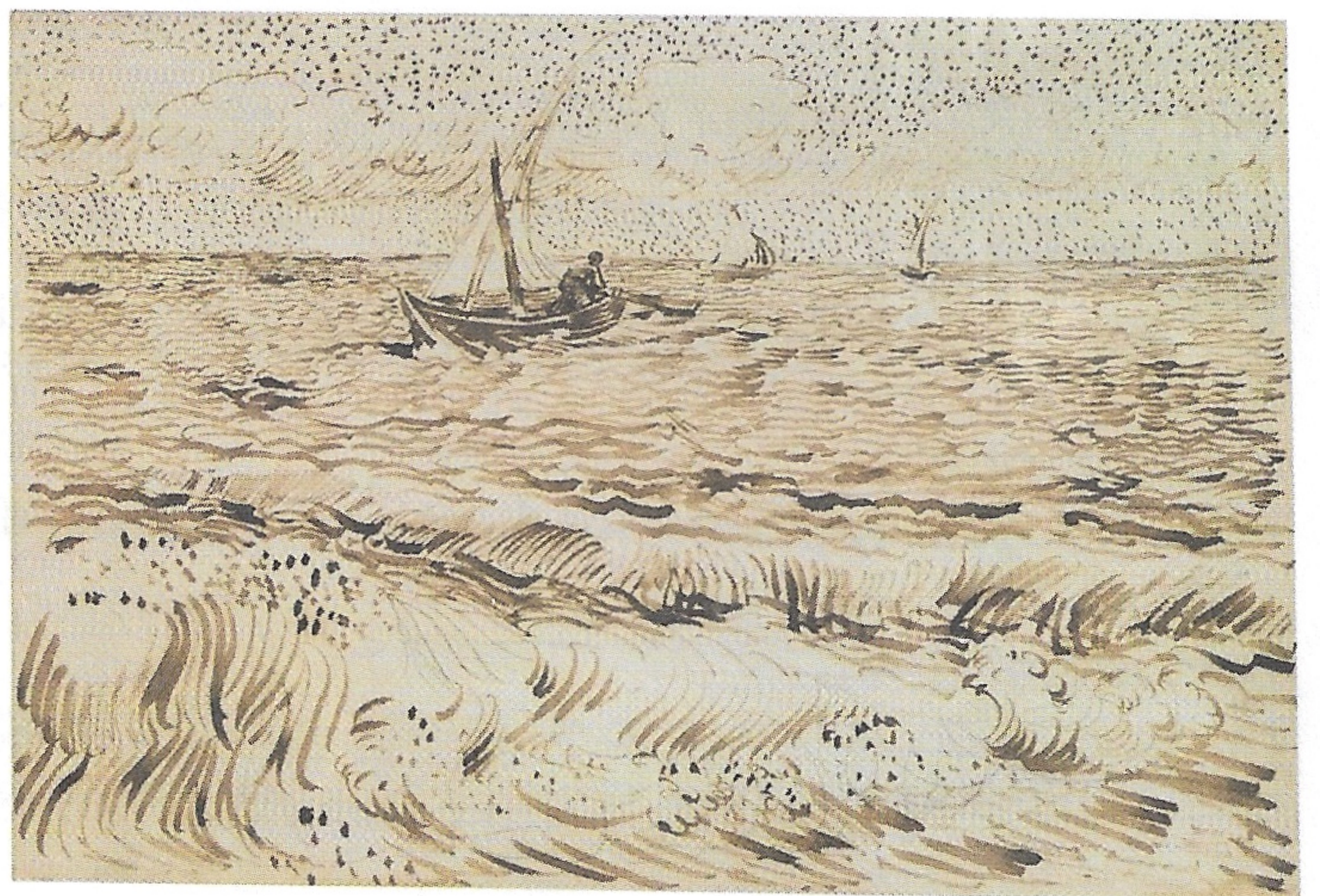
Vincent Van Gogh (1853-1890), Bateaux de pêche aux Saintes-Maries-de-la-Mer , 1888, encre et crayon sur papier, 24,4 x 31,9 cm, Saint Louis Art Museum, États-Unis.